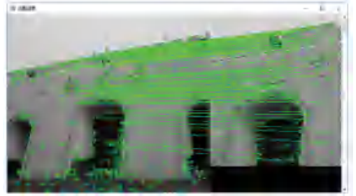
图 3 图片匹配结果

准确率 P = TP / (TP + FP) = 33 / (33 + 1) = 97\% ,召回率 R = TP / (TP + FN) = 33 / (33 + 2) = 94.28\% 。