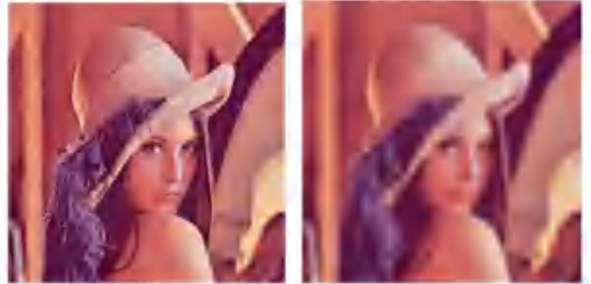
图 1 原图与 \sigma 为 2.0 的对比图